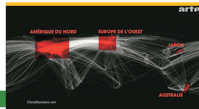
Karte der weltweiten Internetverbindungen